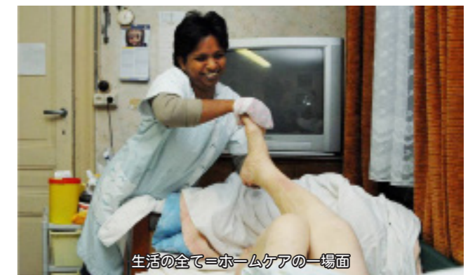
生活の全て=ホームケアの一場面

が、10年の変化は大きく養成については1年間実施されているとのこと。養成費用は無料という説明でした。懇談した組織は12,000名を抱える大規模な所で、ヘルパーさんは2週間に1度必ず集まってカンファレンスを開いているとの事です。働き方は日本とよく似た直行・直帰型でした。