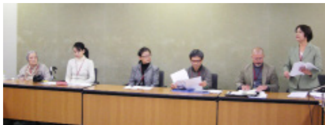
会見は「要介護高齢者の暮らしを考える会」として開きました。10社に関心を持って頂きました。

10月18日のNHKの朝のニュースで流れてきた耳を疑う報道。それは「掃除が45分で終了して、15分無駄な話をして帰るヘルパーの生活援助は非効率率」といった内容でした。驚いてすぐに厚生労働省に電話すると、「社会保障審議会給付費分科会で厚生労働省から提案した内容」とのこと。余りに現状と違いがあることを訴えたが、窓口の職員に言っても始まらないと思い、何か発信の手立てがないかと友人の記者に相談すると「記者会見」を試みたらとのアドバイスを受けた。準備期間はわずかでしたが、今回と次号で厚生労働省記者クラブでの記者会見の様子をお伝えします。