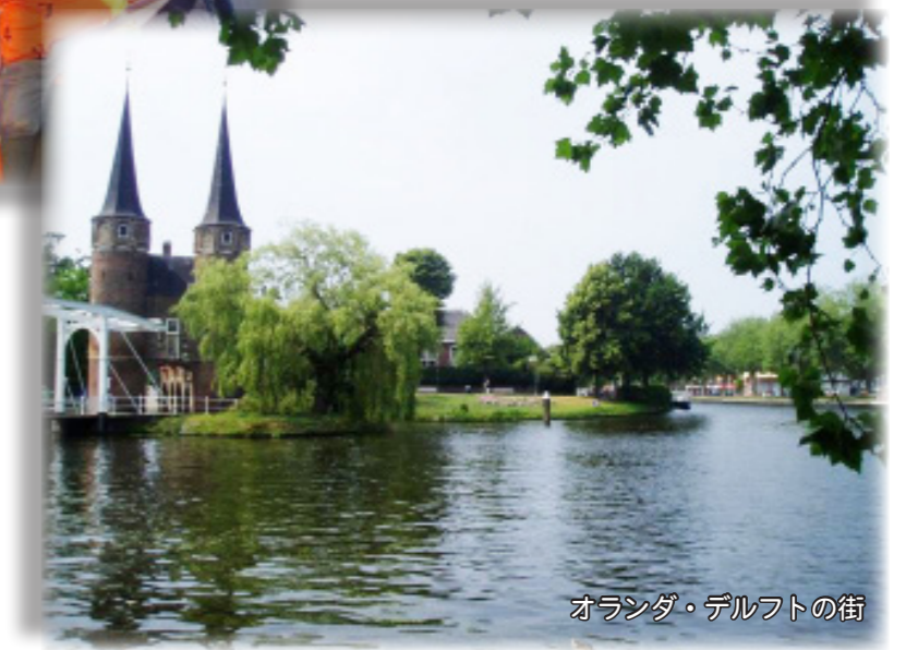
オランダ・デルフトの街