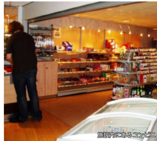
施設内にあるコンビニ

現状の今、起きている問題や課題を知る良い機会だったと思います。また、2次会での話もとても勉強になる話でした。交流を持って本当に良かったです。ありがとうございました。