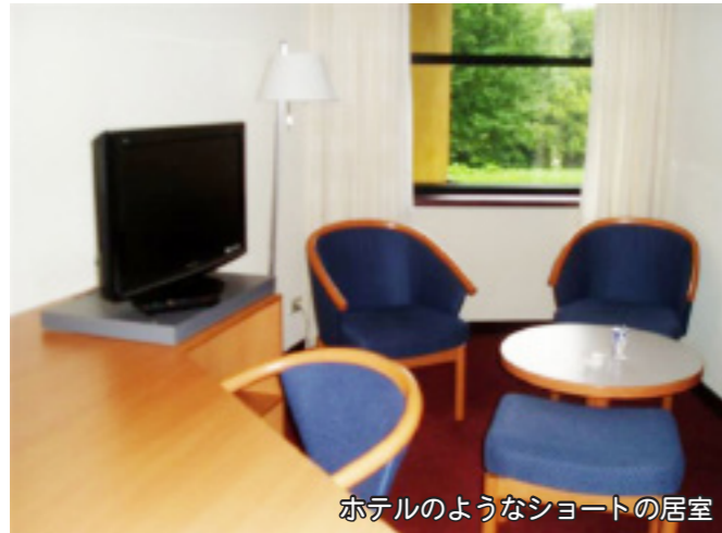
ホテルのようなショートの居室

訪問は1時間や1時間30分が多いが、10分という単位もあり、点眼や見守り（安否確認）が主な仕事。「普通は必要がないけれど」と前置きがあり、血圧測定等する場合もあるとのこと。精神的なケアは認められており、できるだけ自宅で過ごせる様にサポートしています。移動時間は自転車で15分位です。ケアの時間が不足している場合は、コーディネーターに足りない点を伝えるとすぐに調整してくれています。「家族へのレスパイトについても保障されている」と見せて頂いたショートの一部「屋はワインもセットされ、ホテル並みでした！