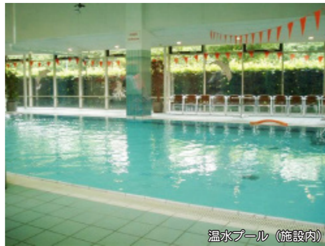
温水プール（施設内）

また、見学の際、温水プールや食堂とカフェにレストラン、売店に美容室等、普通に生活できる空間と、地域の方も参加し楽しめるような作りとなっていること、単身での入居者の方の部屋と家族での入居者の方の2つの部屋とホテル並のショートは北欧での設備と遜色がありませんでした。