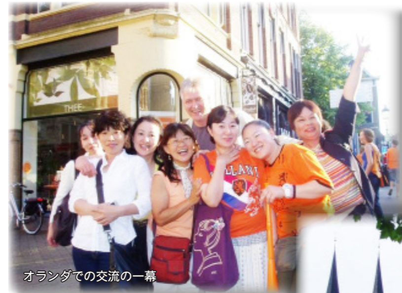
オランダでの交流の一幕

イギリスでもオランダでもケアの現場環境は衝撃的に差がありすぎて……毎度ですが日本の在宅を支える8割近いヘルパーにまず、最低基準の労働基準法を守った対応をする事でケアの質が保証される事について、仲間・地域から合意を広げ国民的支持につなげる「発信と実践」を続けていきたいと思いました。