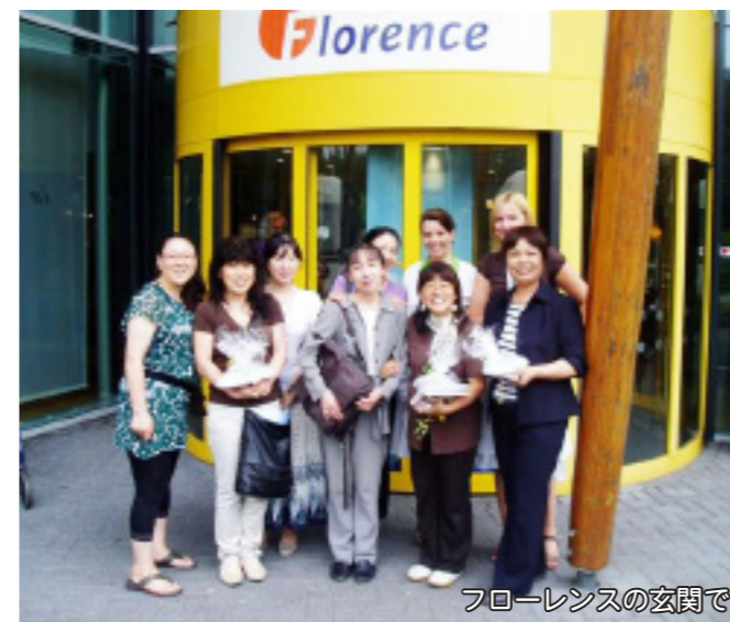
フローレンスの玄関で

7月10日(土)訪問したオランダ・ライスウィク市(人口6万人・高齢化率15%)では地域新聞が事前に日本からの訪問を1面で報道がありました。また、勝ち進んでいるサッカーの決勝戦当日にあたり、懇談に参加するヘルパーさんを探すのに苦労されたとのことでしたが、素敵な3人の方々とサッカーで沸きあがるデルフトの街で夕食を取りながら懇談。翌日は3人の方々が所属している「フローレンス」という事業所で、オランダの介護保険の説明と施設見学をしたり、昼食をご馳走になったりと充実した内容でした。